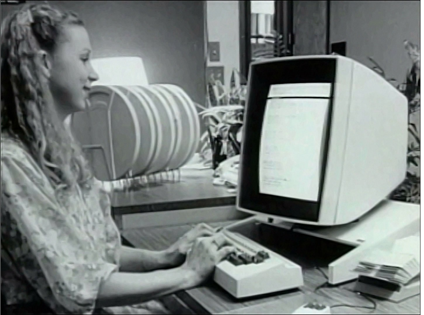
Estación de trabajo Xerox Alto

La interfaz gráfica, aunque popularizada por Apple, no fue inventada por Apple. El primer ordenador en usar este estilo de interfaz fue el Xerox Alto, desarrollado por Xerox PARC (Palo Alto Research Center) en Palo Alto, California. Dice la leyenda que Apple robó la idea de esta interfaz a Xerox pero esto no es cierto..